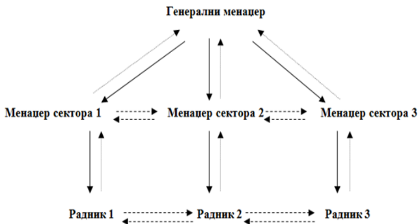
Схема 1 – Пример конфигурације радних односа у организацији 7

На пример, као што је приказано на Схеми 1, такав облик друштвене контроле може да се појави међу радницима или међу менаџерима